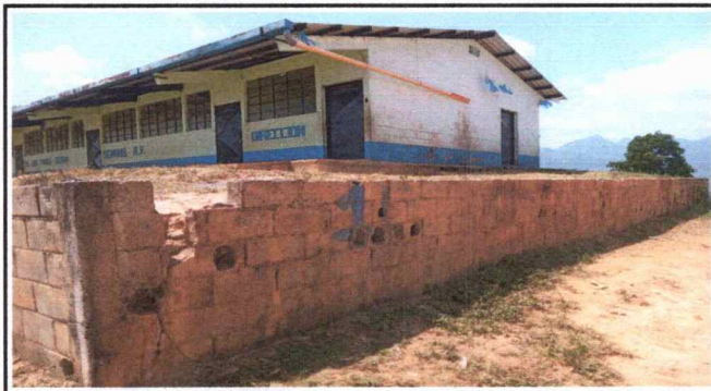
Foto 1: se observa el deterioro de muro de soporte de la escuela.