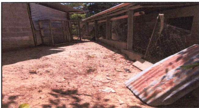
Foto 5: se observa el deterioro de la malla de circulación de la parte de atrás del establecimiento.