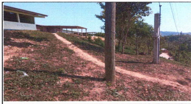
Foto 6: se observa el riesgo de una pendiente en la parte de enfrente del establecimiento.

Observación: Si es necesario se pueden agregar hojas adicionales y actualizar el número de hojas.