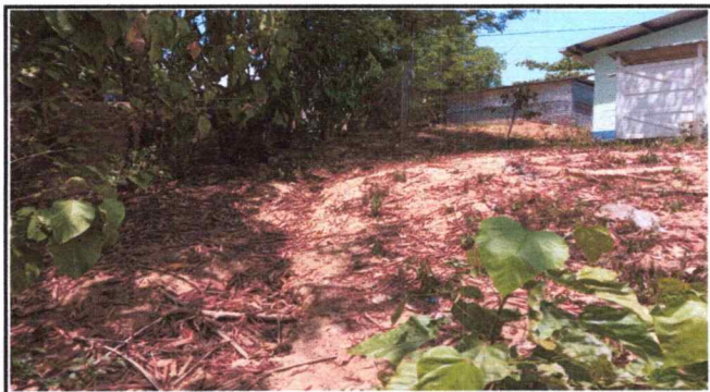
Foto 3: se observa el riesgo de una pendiente cerca del establecimiento.